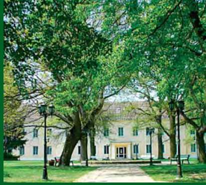
Vital- & Seminarhotel Preußischer Hof