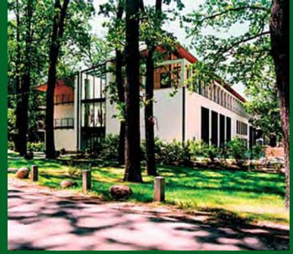
bbw Kommunikationszentrum auf Hubertusstock